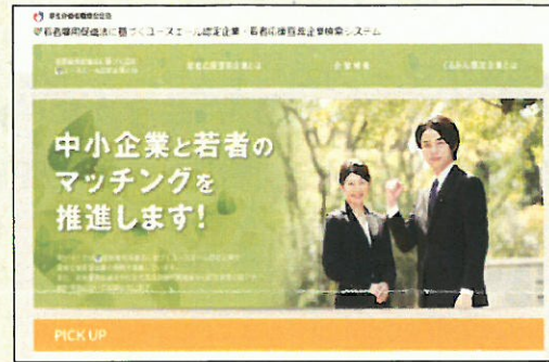
「若者雇用促進総合サイト」

個別企業ごとに企業概要、雇用管理の状況、求職者に向けたメッセージなどを掲載することで、積極的な企業情報の発信と若者とのマッチングを促進していきます。