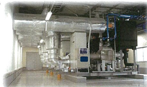
<冷凍冷蔵倉庫への導入イメージ>