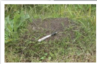
ヒアリが作る大きなアリ塚