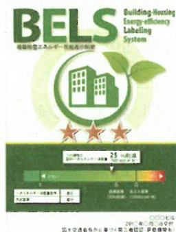
〔図1〕 ガイドラインに基づく第三者認証の例

また、デマンドレスポンスに対応した時間帯別・季節別の電気料金メニューが選択できる場合はその活用に努めるとともに、エネルギー管理システム（BEMS・HEMS等）の導入により、ビルの運用方法、住宅の住まい方の改善によるピーク対策及び省エネルギーに努めること。