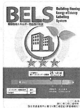
[図1] ガイドラインに基づく第三者認証の例

また、デマンドリスポンスに対応した時間帯別・季節別の電気料金メニューが選択できる場合はその活用に努めるとともに、エネルギー管理システム（BEMS・HEMS等）の導入により、ビルの運用方法、住宅の住まい方の改善によるピーク対策及び省エネルギーに努めること。