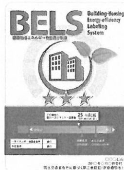
〔図1〕 ガイドラインに基づく第三者認証の例

また、ダイヤモンドリスポンスに対応した時間帯別・季節別の電気料金メニューが選択できる場合はその活用に努めるとともに、エネルギー管理システム（BEMS・HEMS等）の導入により、ビルの運用方法、住宅の住まい方の改善によるピーク対策及び省エネルギーに努めること。