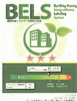
〔図1〕 ガイドラインに基づく第三者認証の例

また、ディマンドリスポンスに対応した時間帯別・季節別の電気料金メニューが選択できる場合はその活用に努めるとともに、エネルギー管理システム（BEMS・HEMS等）の導入により、ビルの運用方法、住宅の住まい方の改善によるピーク対策及び省エネルギーに努めること。