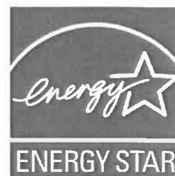
[図4] 国際エネルギースターロゴ