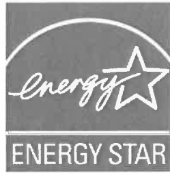
[図5] 統一省エネラベル※